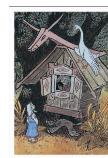
1) Каша из топора 2) Журавль и цапля 3) По щучьему веленью 4) Волк и лиса 5) Сивка-бурка 6) Скупой поп и работник 7) Гуси-лебеди