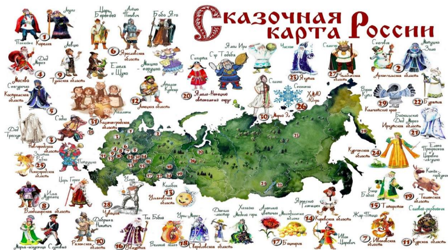
Приложение 3. Тексты сказок для сопоставления